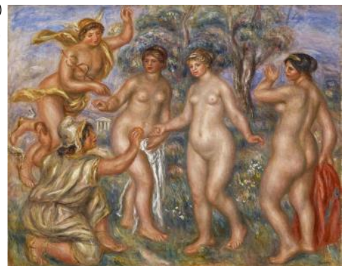
オーギュスト・ルノワール「パリスの審判」1913-14頃 油彩、カンヴァス