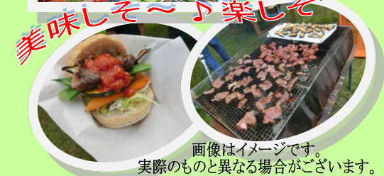
画像はイメージです。実際のものとは異なる場合がございます。