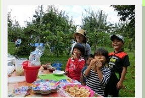
画像はイメージです。 実際のものとは異なる場合がございます。